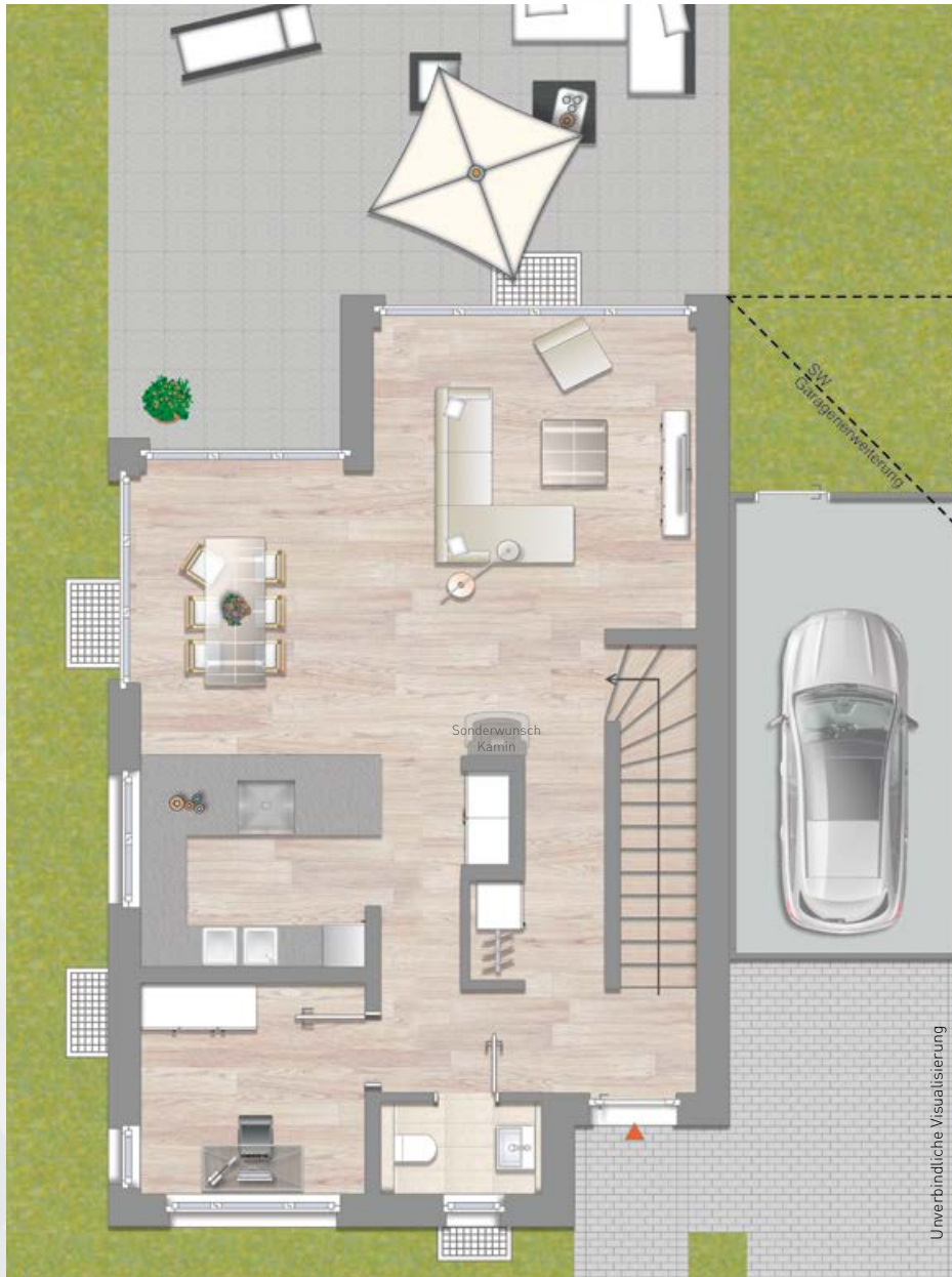
Villentyp Plura, Erdgeschoss, 197,46 m 2 Wohnfläche